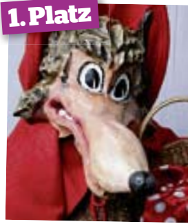
De beschi Grend Maske von Rolf Wullschlegler LU.